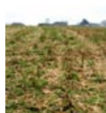
Récolte le 24 novembre 2008