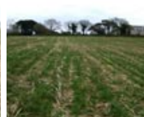
Parcelle au 27 février 2009