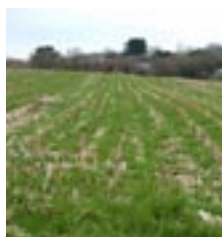
Parcelle au 27 février 2009