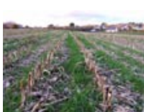
Récolte le 5 novembre 2008